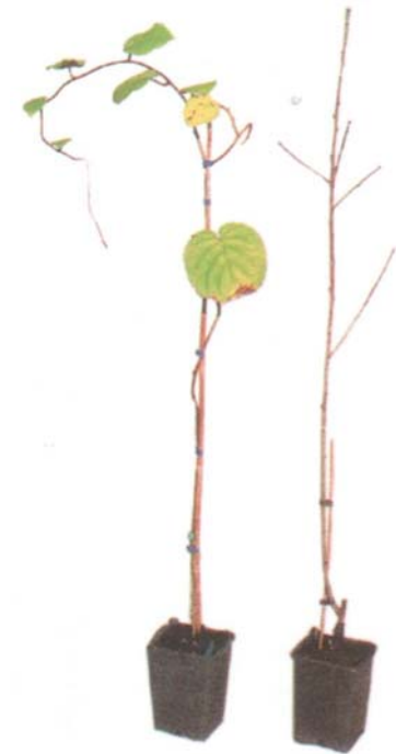
Piante autoradicate e innestate, in vaso